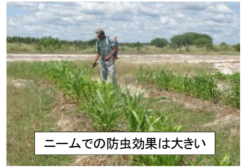
ニームでの防虫効果は大きい

かえません。レダでは、ニームがよく育っていますので、現在第二農園奥のトウモロコシ畑では、虫がついて来たため、ニームの葉のエキスをとり、バケツ一杯の水に1リットルのエキスを混ぜて、散布したところ効果があるようです。(飯野元理事より)