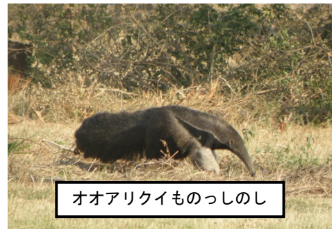
オオアリクイものっしのし