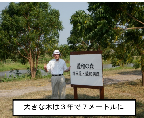
大きな木は3年で7メートルに

ました。専門家が調査。オオアリクイ・コアリクイをはじめ、アルマジロ、鹿数種、アメリカライオン、ティグレ、人気のカピバラ、ワニ、カワウソ等。また、豊かな森には、多くの野鳥が舞