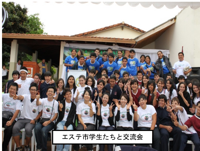
エステ市学生たちと交流会

思いでした。ディアナ村でもスケジュールを聞いた時点ではもっとガツガツ奉仕しようとして来たのに、結構、文化交流の時間も長くてどうなのかなあという感じもあったのですが実際にインディオの村で生活して見て、現地の方々と交流しながらやっ