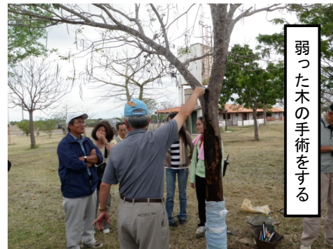
弱った木の手術をする