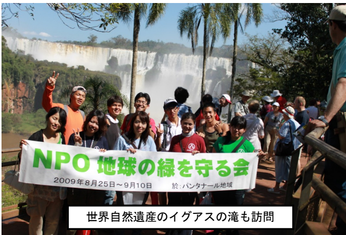
世界自然遺産のイグアスの滝も訪問