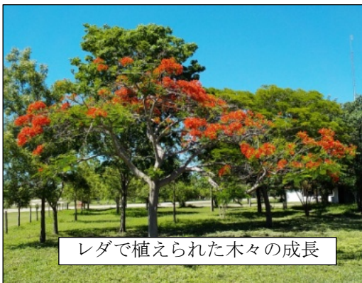
レダで植えられた木々の成長